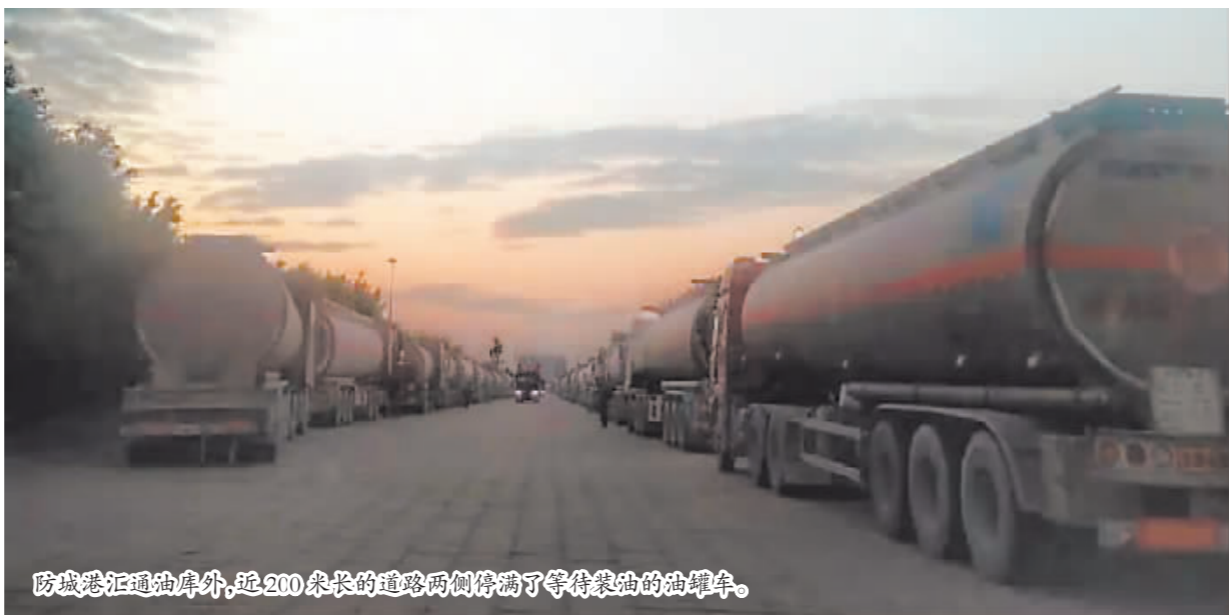
防城港汇通油库外,近200米长的道路两侧停满了等待装油的油罐车。