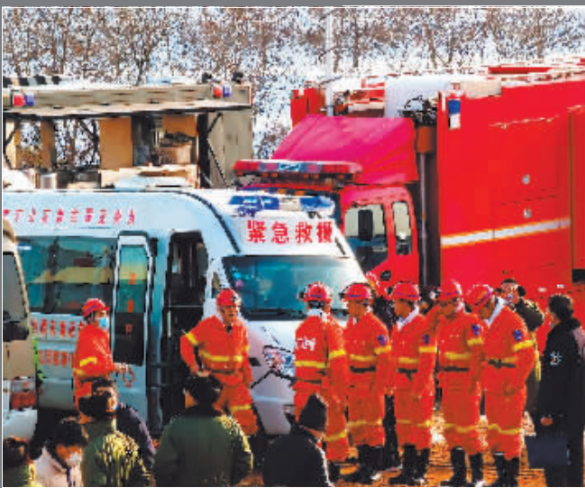
山东笏山金矿爆炸事故救援现场(1月12日报)。

“林长制是从基层的实践总结提升的,其生命力在于实践,在于解决人民群众的关切和需要。”关志鸥强调,要始终坚持以人民为中心,以问题为导向,把林草资源的保护发展与人民群众的需求始终紧密结合起来。各地要因制宜、大胆创新,科学确定林长制的分级设置、主要任务等,根据资源禀赋的差异,实行分类考核,不搞“一刀切”。