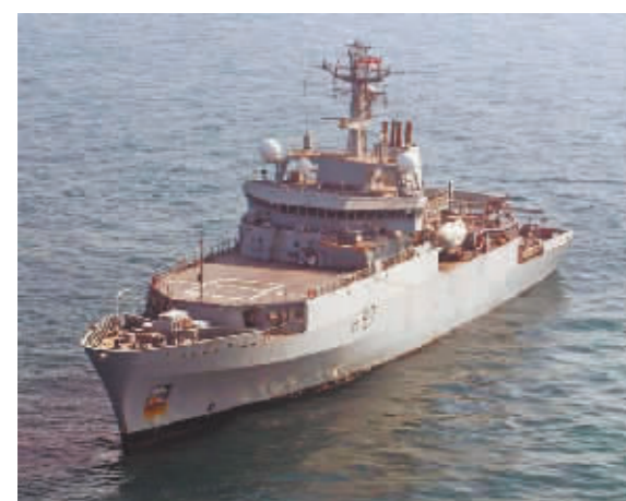
2018年12月21日,在乌克兰港口城市敖德萨的一艘英国皇家海军军舰。

英国国防大臣·华莱士对上述国防投资计划表示极大欢迎。他在接受英国媒体采访时称,在过去20到30年里,英国国防部的“壮志雄心”与国防拨款从未匹配过,尽管英国政府近年的国防预算每年都有大约400亿英镑。