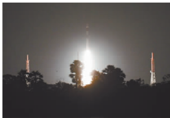
2018年9月16日,印度利用PSLV-C42型运载火箭进行商业发射,将两颗英国卫星送入太空。

英国白金汉大学教授、欧洲安全问题专家安东尼·格里斯指出,约翰逊对太空和网络领域的重视表明,英国希望尽早摆脱对欧盟太空计划的依赖。