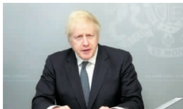
英国首相约翰逊11月19日宣布,英国政府将在未来4年内追加总共165亿英镑的军费投入。

这是冷战结束后英国政府最大规模的国防投资。分析人士认为,英国政府此举对内能通过新建国防项目创造就业机会,对外则旨在巩固英国作为“最受美国青睐的军事伙伴”地位,谋求增强“脱欧”后英国的全球影响力。