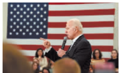
拜登 非常坦率地说,我认为这很令人尴尬。