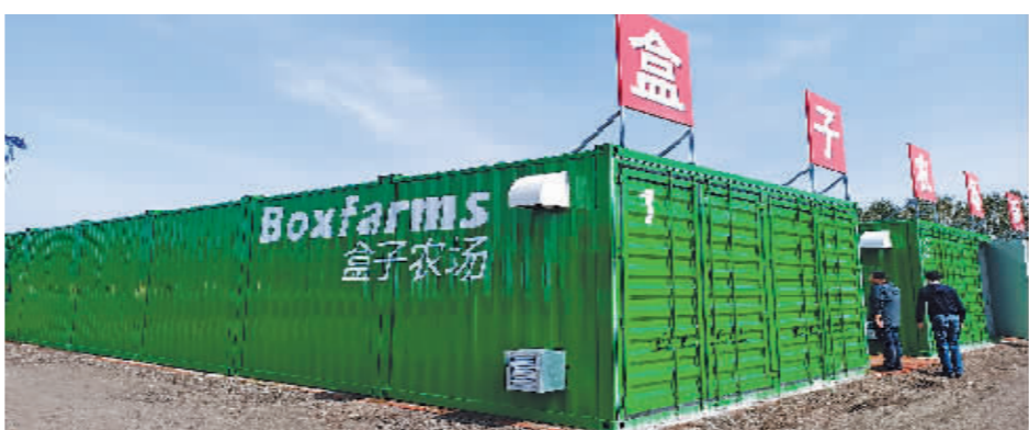
东官农业合作社园区里的“盒子农场”。

从“大脑”再往里走,就进入了“盒子农场”的种植区,现在14个“盒子”里种植的都是双孢菇。在分层码放的食用菌架上,一簇簇白色的双孢菇朵朵“盛开”,在“大脑”量身定制的环境里长大,它们长得又快又美,更有营养。(下转第二版)