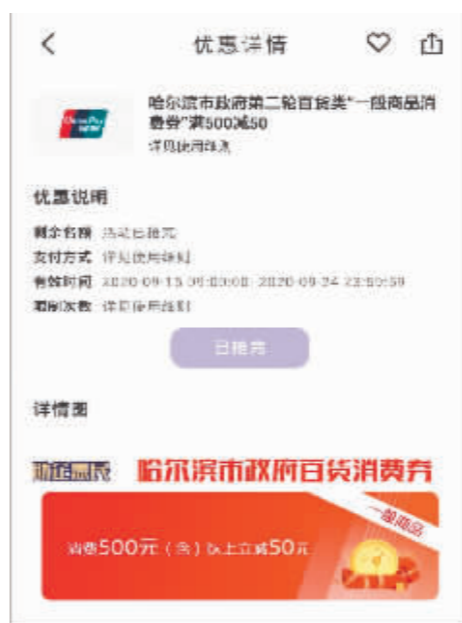
消费500元减50元政府百货消费券。

接下来,政府部门将适时推出新一轮消费券。政府部门、中国银联也将利用好大数据,根据核销的具体效果动态调整配券。