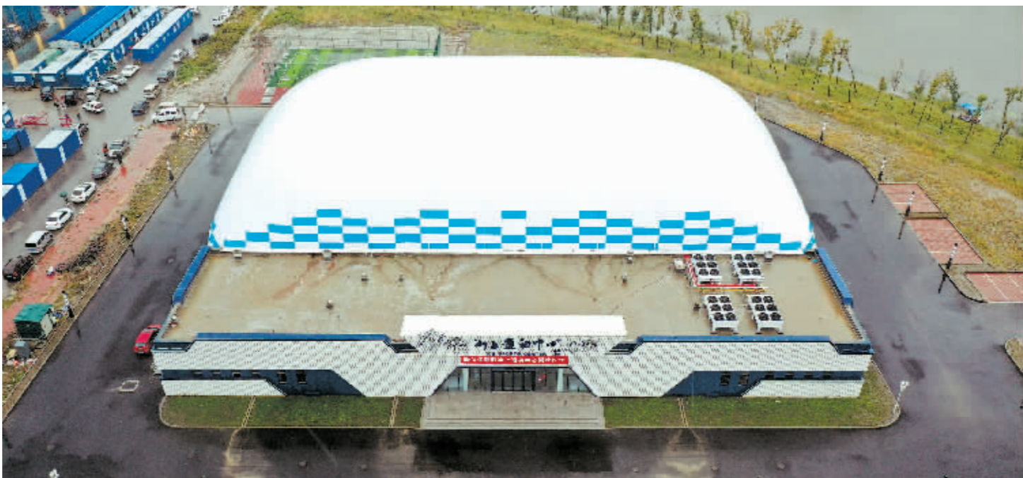
俯瞰气膜冰上运动中心。

这段时间,哈尔滨拔地而起了好几个外形结构像“大气球”的建筑物。好奇的市民都在问,这些建筑物是用来做什么的?其实,这些“大气球”是哈尔滨新建的冰上运动中心,和很多土建和钢结构建筑不同,它是依靠室内气压大于大气压的原理,被“吹”起来的建筑。