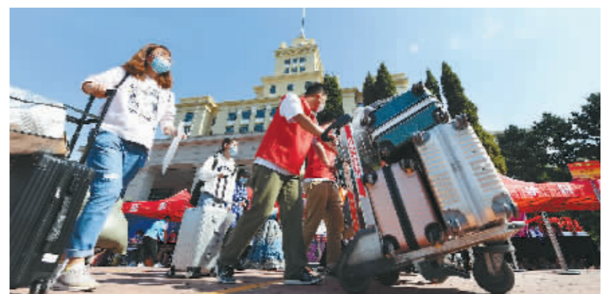
黑大主楼前,办完手续的新生们在老生带领下走向宿舍。李云霄 本报记者 刘洋摄

系统和“今日校园”App,提前为新生提供报到流程查询、每日健康打卡、一键扫码缴费等服务,让新生切实感受到智能化和大数据带来的快捷便利。