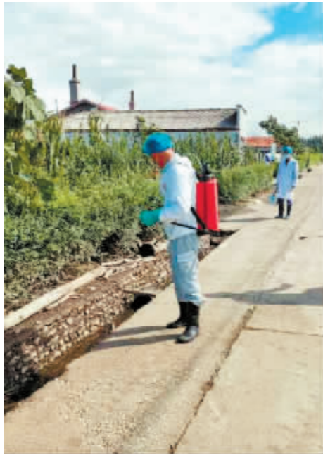
对受灾村屯进行全面消杀。