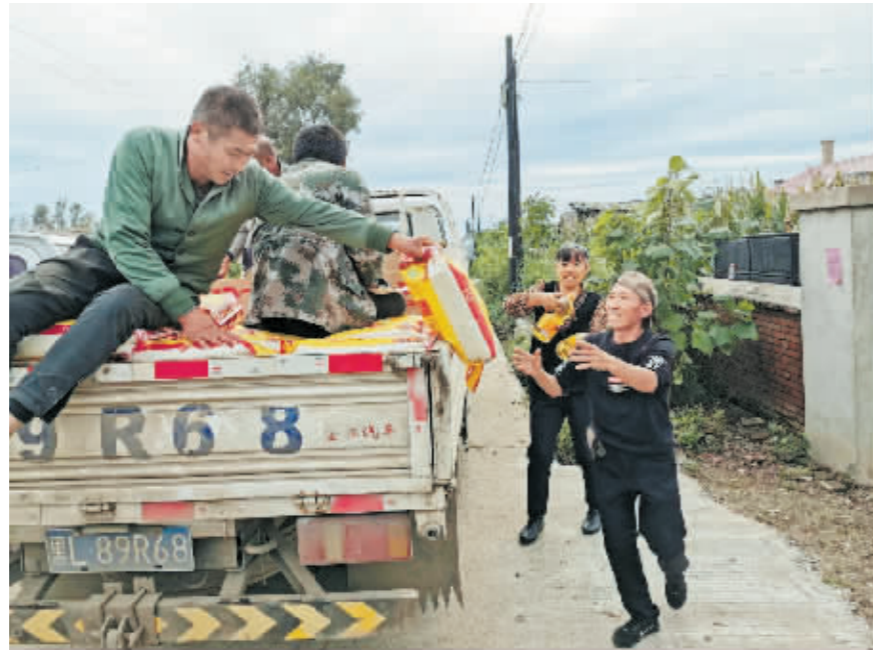
大米和豆油发放给受灾村民。

除了医护人员外,第一时间进村的还有依兰县电力、疾控和畜牧等部门工作人员。依兰县由县领导带队,相应职能部门组成的工作专班开始长期进驻受灾村屯。重点对房屋设施、饮水储水器具进行