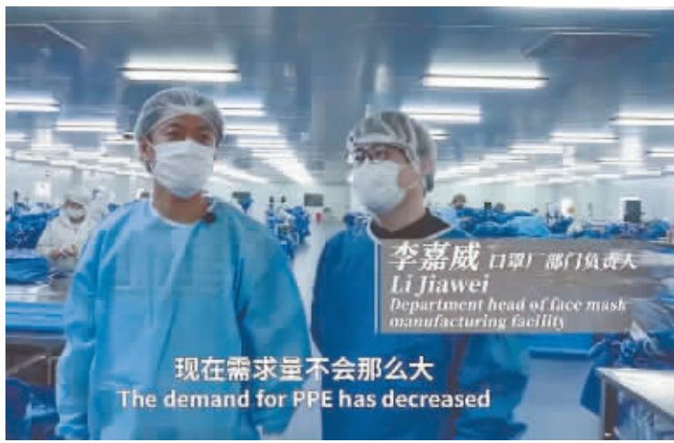
现在需求不会那么大 The demand for PPE has decreased