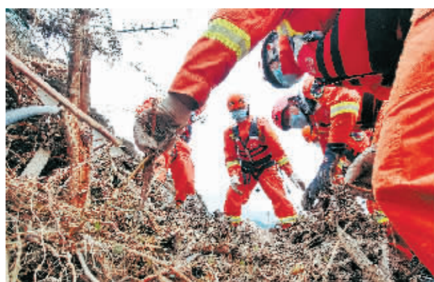
救援队员在四川冕宁县彝海镇搜救(6月28日摄)。

6月28日8时至6月29日8时,武汉市普降大暴雨,24小时最大降雨量达165.9毫米,全市多处路段出现渍水。据武汉市气象部门预报,后续武汉市仍将有暴雨发生。为确保城市安全,根据《武汉市城市防洪应急预案》规定,武汉市防汛抗旱指挥部启动城市排渍Ⅲ级应急响应(黄色)。