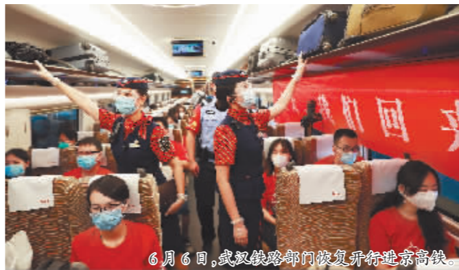
6月6日,武汉铁路部门恢复开行进京高铁。

冯子健认为,经过艰苦努力,付出巨大牺牲,当前湖北武汉地区的病毒传播已基本阻断,但绝不意味着疫情结束,外防输入、内防反弹的压力依然较大。