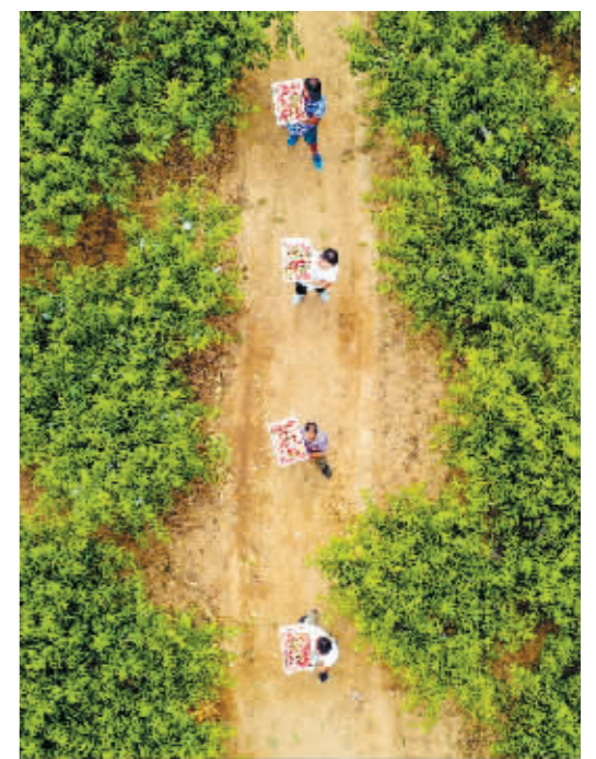
6月29日,河北省永清县后奕镇石各庄村果农在搬运刚采摘的鲜桃。

河北省永清县后奕镇石各庄村聚焦“一村一品”建设,大力发展鲜桃种植产业,目前已形成近万亩的种植规模,成为村民致富的特色产业。 新华社发