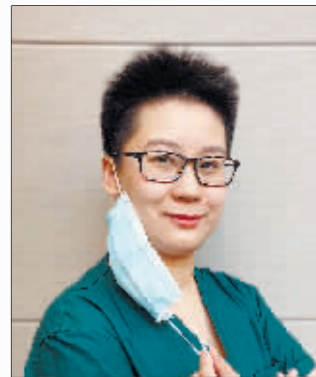
管乐 黑龙江省农垦总局医院神内三科护士长