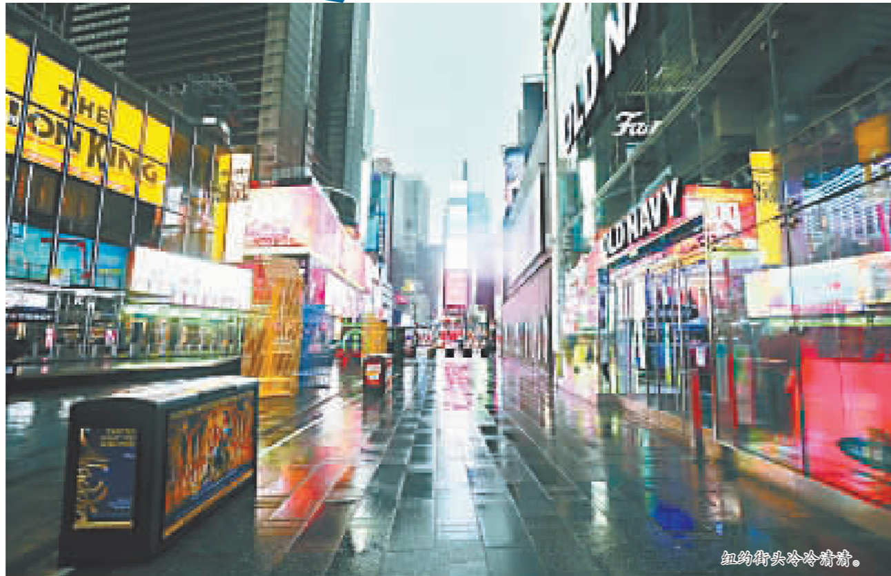
纽约街头冷冷清清。