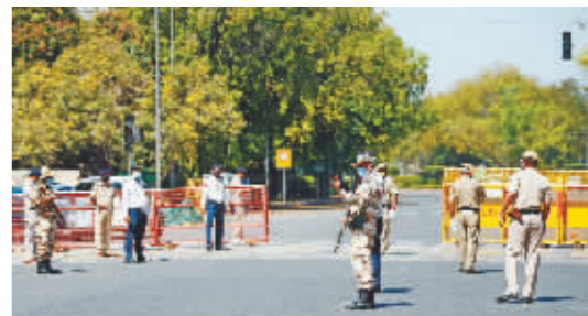
在印度新德里,安全人员在“封城”期间封锁道路。