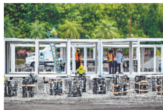
在巴拿马首都巴拿马城,工人参与方舱医院建设。