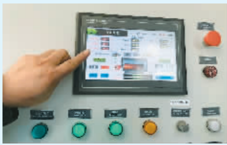
哈医科大学燃气锅炉房设备区的监控设备。