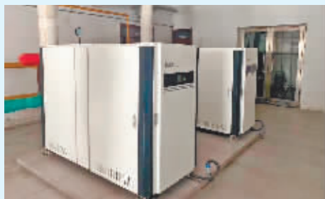
铁路东棵小区锅炉房燃气供暖设备。