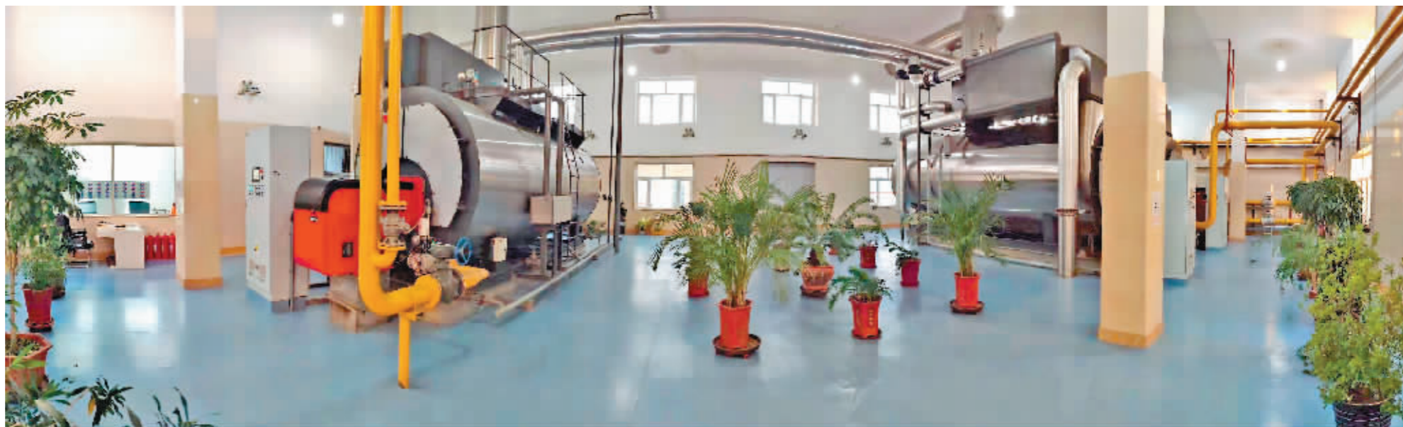
哈尔滨医科大学锅炉房燃气设备。

依据国家部署,下月起,历时两年建设的中俄东线天然气管道工程北段投用,“俄气”入境龙江,或将为冰城燃气供暖“扩容”提供有力支撑。哈尔滨现有的燃气供暖质量如何?运营成本怎样?记者探访了多个燃气供暖点位。