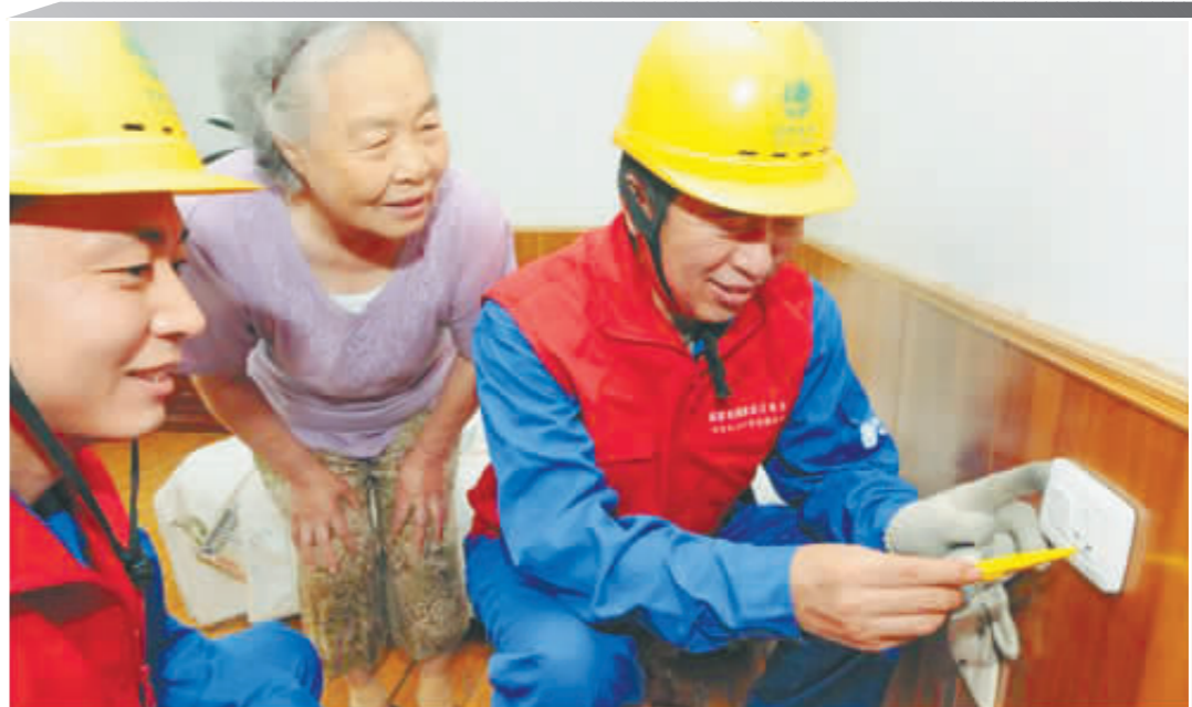
李庆长共产党员服务队为孤寡老人解决用电难题。