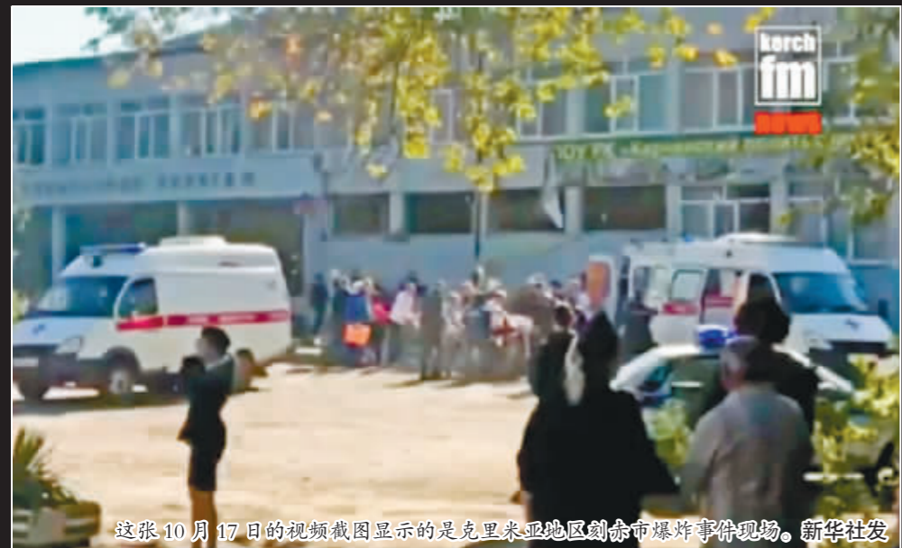
这张10月17日的视频截图显示的是克里米亚地区刻赤市爆炸事件现场。

当地时间17日,克里米亚一所学校发生爆炸导致至少10人死亡50人受伤。据俄罗斯媒体报道,俄罗斯调查机构称,这起校园爆炸是恐袭事件,爆炸装置中装满了杀伤性金属物体。