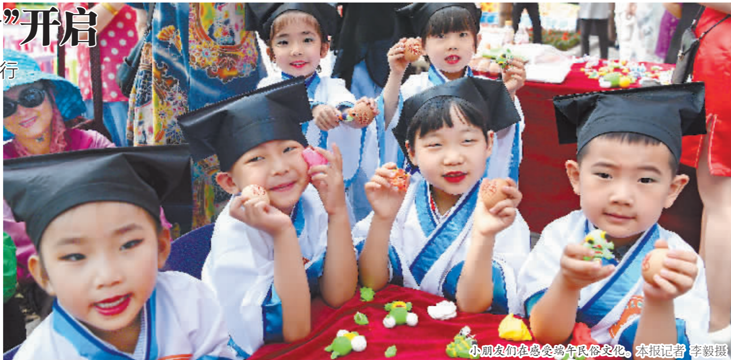
小朋友们在感受端午民俗文化。本报记者 李毅摄

本报讯(记者 王越)祖传的蜜糖糖画、各式各样的绘画彩蛋……昨天,为弘扬中华民族优秀传统文化和传统美德,挖掘端午民俗文化,省、市文明办和道外区以“百年老街端午情,印象中华巴洛克”为主题在中华巴洛克历史文化街区举办“我们的节日·端午”主题活动。