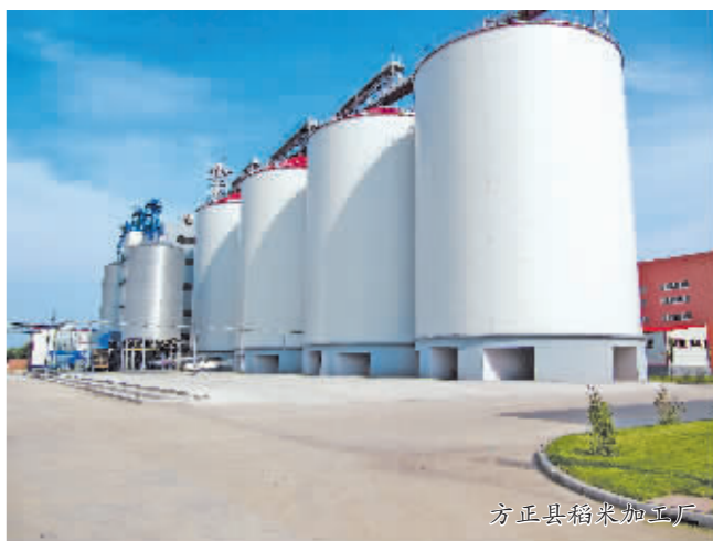
方正县稻米加工厂