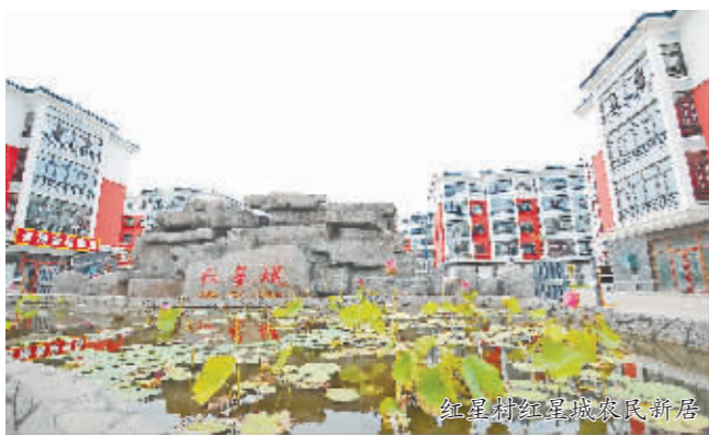
红窑村红窑城农民新居