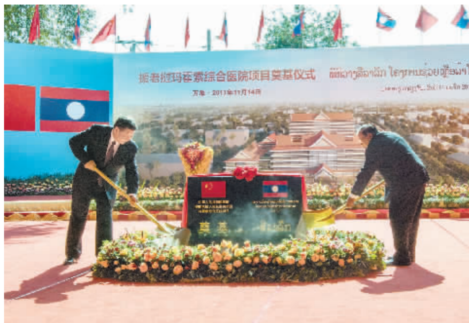
左图:习近平同老挝人民革命党中央委员会总书记、国家主席本扬一道出席玛霍索综合医院奠基仪式。